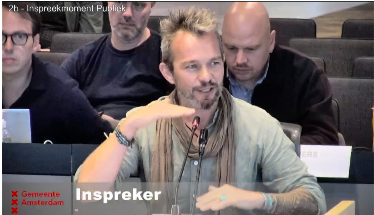
Inspraak namens de bij in de gemeenteraad van Amsterdam

In sommigen gemeente (zoals Amsterdam) is dit drie minuten. Houd er ook altijd rekening mee dat je kort voor het inspreken te horen krijgt dat je toch maar 3 minuten spreektijd krijgt. Heb dus altijd een lange en een korte versie van jouw spreektekst bij je. Anders loop je het risico dat je niet niet aan je eindoproep toekomt, dat zou natuurlijk zonde zijn.