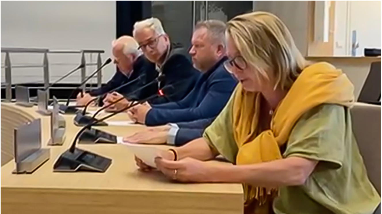
Inspraak namens de bij in de gemeenteraad van Utrecht