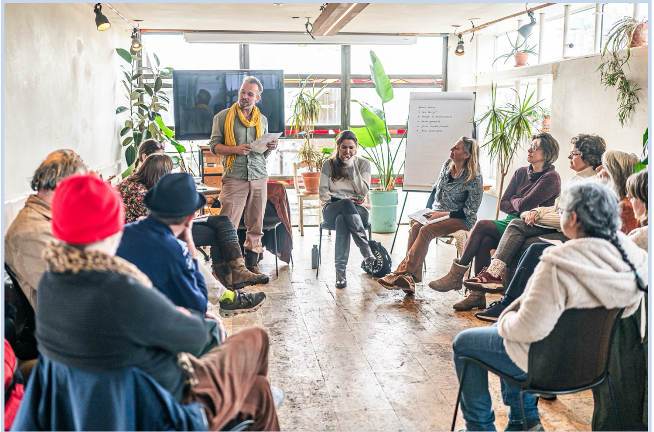
Workshop 'Rechten van de Bij - Inspreken voor burgers' op de Ceudel.